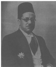
مكرم عبيد باشا رئيس حزب الكتلة الوفدية